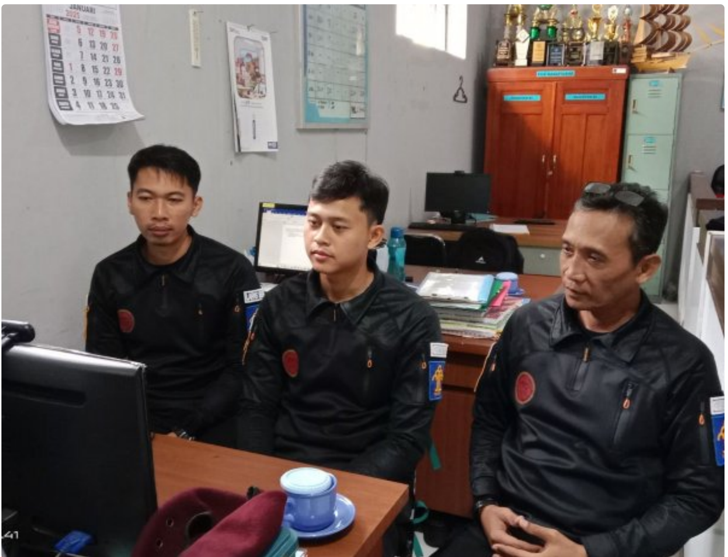
Bangun Harmoni dan Strategi, Lapas Besi Ikuti Webinar Refleksi Akhir Tahun 2024 & Resolusi 2025

CILACAP – Sebagai salah satu langkah dalam pengembangan kompetensi bagi Aparatur Sipil Negara (ASN), Petugas Lembaga Pemasyarakatan Kelas IIA Besi berpartisipasi dalam kegiatan webinar bertajuk "Refleksi Akhir Tahun 2024 dan